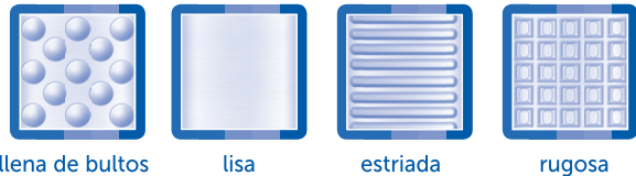
llena de bultos

Como referencia, echa un vistazo a las siguientes imágenes de texturas incluidas en este set: